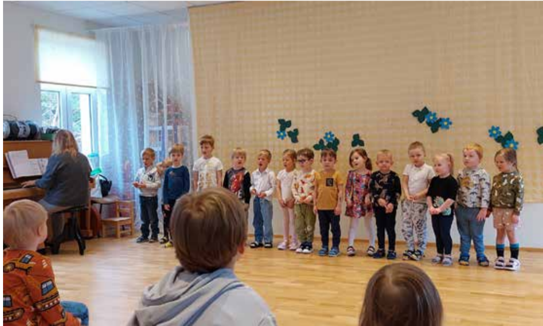
4–5-aastaste rühmad laulmas.