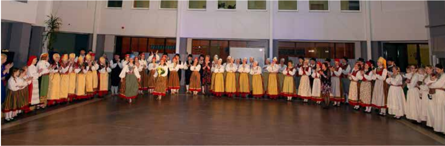
Jõelähtme rahvatantsurühmad Eesti Vabariigi 106. aastapäeval Loo kooli aatriumis.