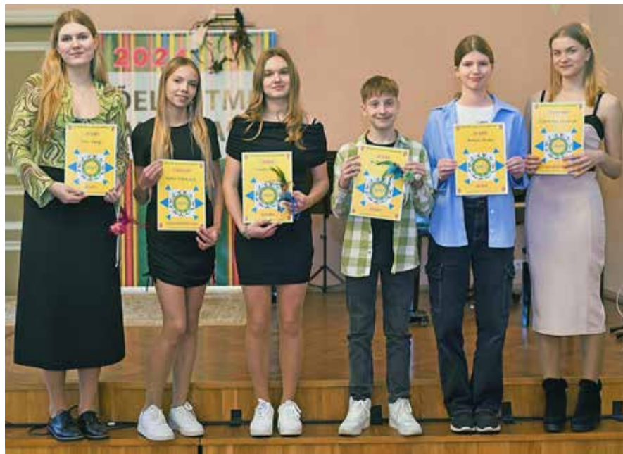
13-15 ja 16-18 aastased lauljad.