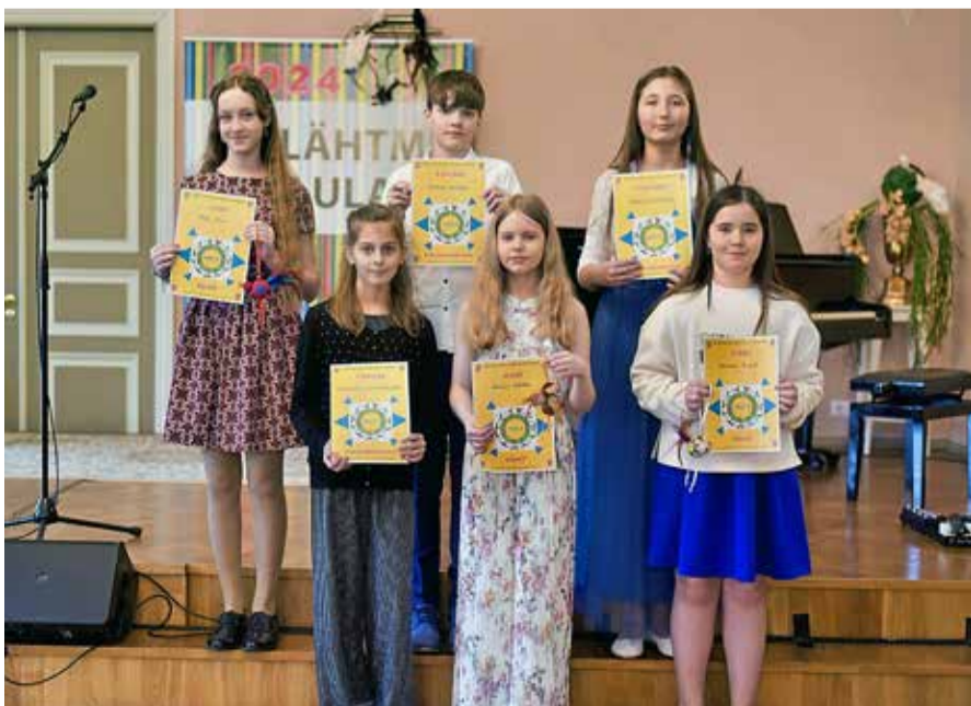
10-12 aastased lauljad.

Kevadised koristustalgud ja ohtlike jäätmete kogumisring