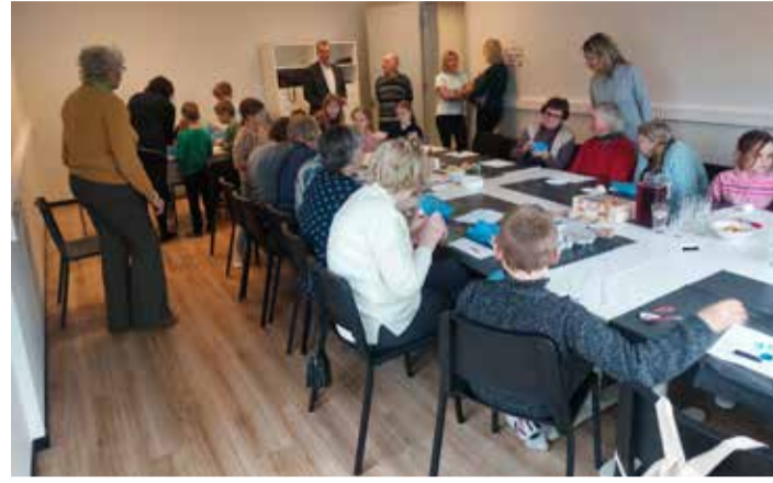
Ühiselt kaunistati lihavõttepühadeks mune.

Sündmusest võttis osa pea 40 inimest, kellest jagu-