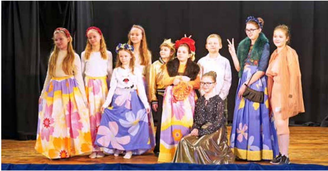
Noorema ja vanema näitetrupi ühispilet.