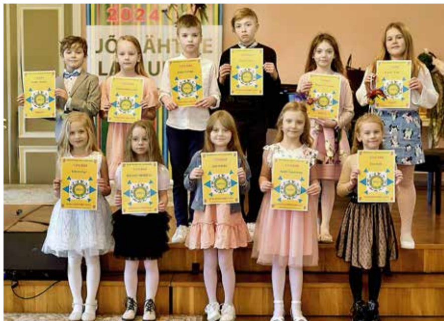
7-9 aastased lauljad.