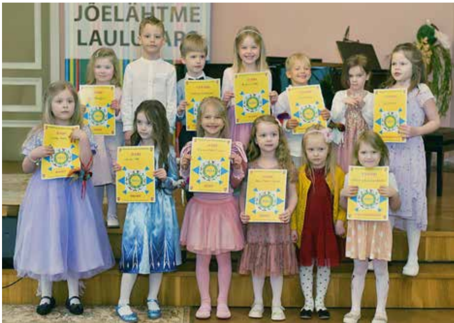
3-4 ja 5-6 aastased lauljad.